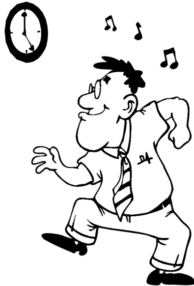
Mae hi'n bump o'r gloch ar ei ben!